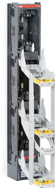
Положение для замены плавких вставок