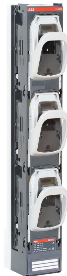
ZLBM3-1P 630 A